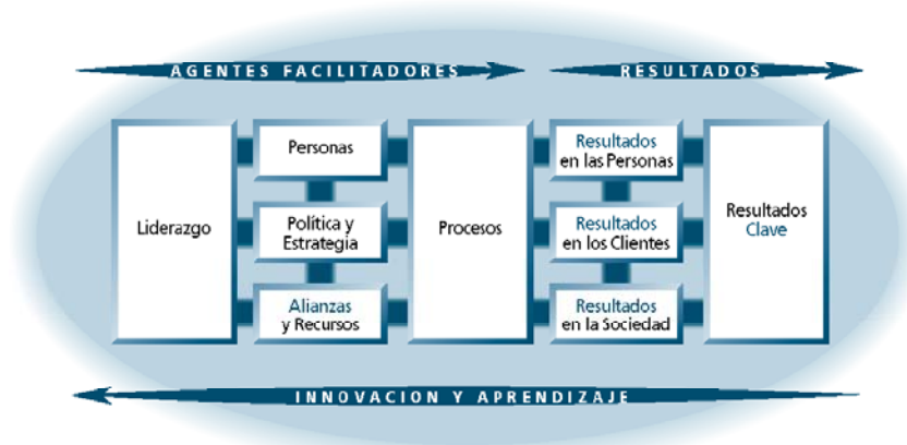
Modelo EFQM de Excelencia

“Los Resultados* Excelentes con respecto al Rendimiento general de una Organización, en sus Clientes, Personas y en la Sociedad* en la que actúa, se logran mediante un Liderazgo* que dirija e impulse la Política* y Estrategia*, que se hará realidad a través de las Personas*, las Alianzas* y Recursos* y los Procesos*”.